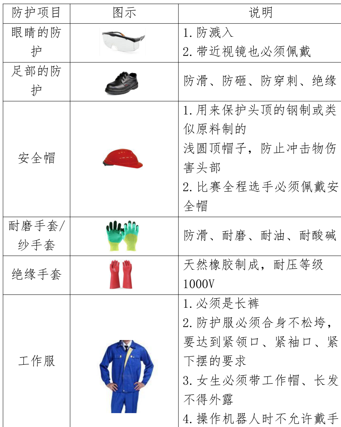
表-7 选手安全防护装备